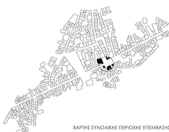
ΧΑΡΤΗΣ ΣΥΝΟΧΙΚΗΣ ΓΕΩΓΡΑΦΙΚΗΣ ΕΠΕΜΒΑΣΗΣ