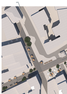
ΚΛΩΝΗ ΕΥΡΥΧΩΡΙΟΥ ΣΚΟΥΦΑ ΣΤΑΜΑΤΕΛΟΠΟΥΛΟΥ ΑΓΙΑΣ ΣΟΦΙΑΣ κλίμα 1:500