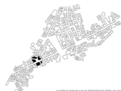
ΚΑΡΤΗ ΣΥΝΟΧΙΚΗΣ ΓΕΩΣΤΡΑΤΗΣ ΕΠΙΒΛΑΣΤΗΣ