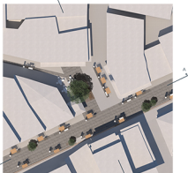
ΚΑΙΩΝΗ ΕΥΡΥΩΡΙΟΥ ΚΑΚΑΒΑ Μήκος 1:200