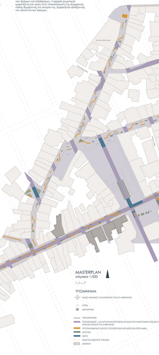
MASTERPLAN κλίμακα 1:500